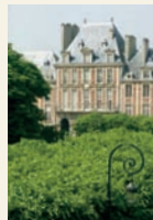
La plaza de los Vosgos desde la Casa de Victor Hugo.

La Ciudad de París conserva los dos lugares donde Victor Hugo (1802-1885) residió más tiempo: el hotel de Rohan-Guéméné, en la plaza de los Vosgos en París (1832-1848), y Hauteville House, en Guernesey, (1856-1870) casa adquirida con el producto de la venta de Las contemplaciones .