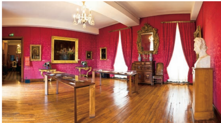
El Salón rojo.