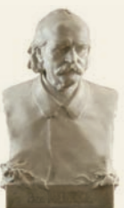
François-Léon Sicard, Paul Meurice , 1907, mármol.

En 1832, Victor Hugo alquiló un apartamento en el segundo piso de este palacete del siglo XVII con vistas a lo que era entonces la plaza Real. Con treinta años, ya se le reconocía como la figura más representativa del romanticismo; estaba casado con Adèle Foucher, con la que tenía cuatro hijos. Durante esta estancia, escribió algunas de sus principales obras: Ruy Blas , Las voces interiores , Los rayos y las sombras y comenzó la redacción de Los miserables , La Leyenda de los siglos y Las contemplaciones .