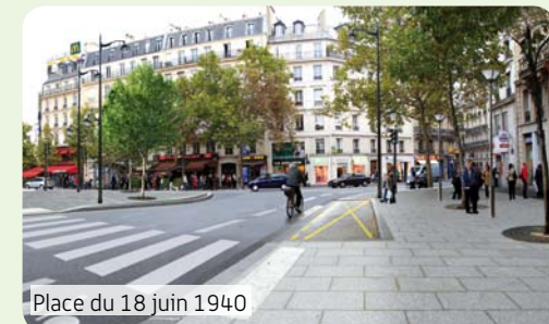
Place du 18 juin 1940