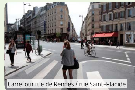
Carrefour rue de Rennes / rue Saint-Placide